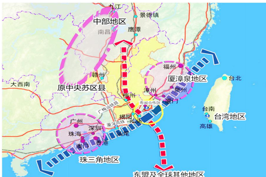
图 6-3 潮州港为原中央苏区县出海口