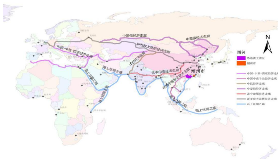
图 6-1 潮州市融入“一带一路”示意图

潮州是广东省沿海开放城市、国家历史文化名城、中国著名侨乡，中国古代海上丝绸之路的重要起点。围绕“政策沟通、设施联通、贸易畅通、资金融通、民心相通”的主要内容，推进潮州市基础设施、经济贸易、产业投资、能源资源、人文交流、吸引侨资侨智等方面与“一带一路”沿线城市的务实合作。